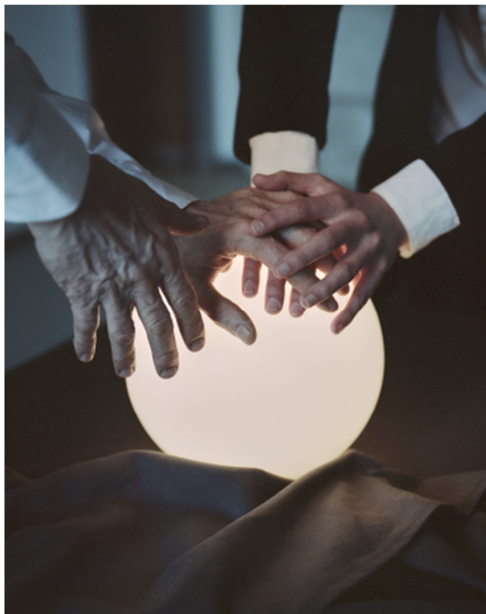
Untitled, de la série Sisyphus , 2018, © Kata Geibl

Kata Geibl, née en 1989 en Hongrie Moholy-Nagy University of Art and Design, Budapest