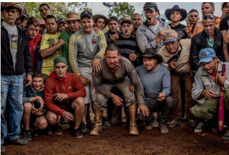
Cockfight in the countryside near Vinales, Cuba.

Le travail des photojournalistes Meredith Kohut, Newsha Tavakolian, Daniel Berehulak, Tomas Munita et Ivor Prickett nous met face à la vérité et nous permet de décrypter la complexité du monde, au-delà de l'analyse des faits.