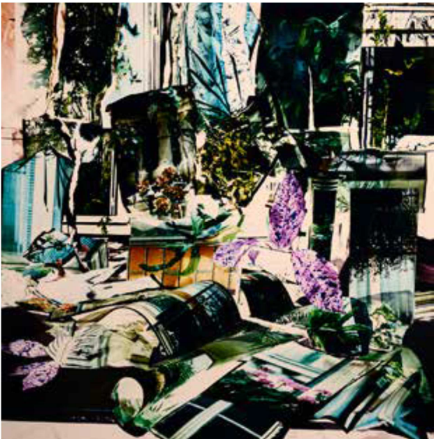
© Baptiste Rabichon / Résidence BMW Album - XI, 2018, 75 x 75 cm

La beauté apparaît ici sous la forme d'une union amoureuse, la réconciliation entre les êtres, les objets et les végétaux.