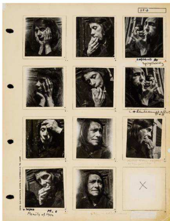
Hiver de la faim / Dutch Hunger Winter, 1944-1945.