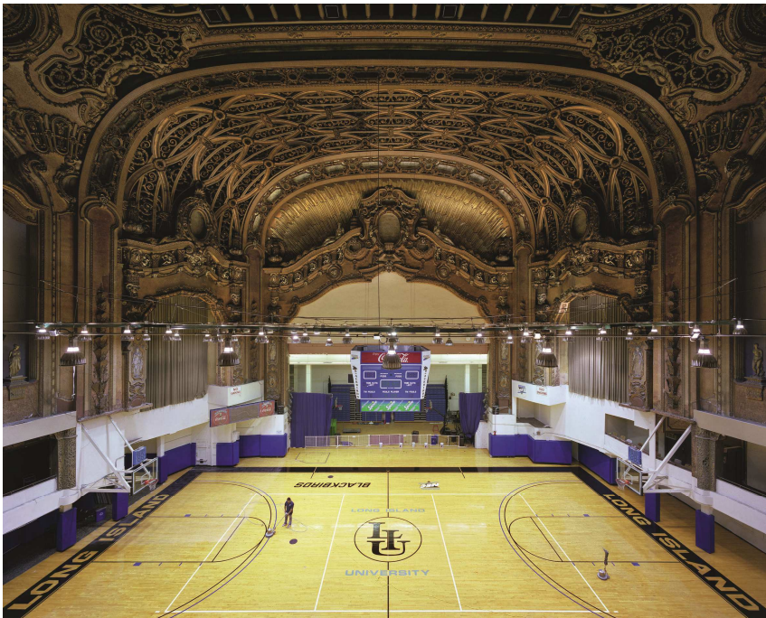
YVES MARCHAND ET ROMAIN MEFFRE. Paramount Theater, Brooklyn, NY, USA, 2008 JPMorgan Chase Art Collection