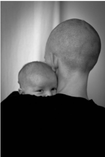
© Henri Guittet / Estée Lauder Pink Ribbon Photo Award