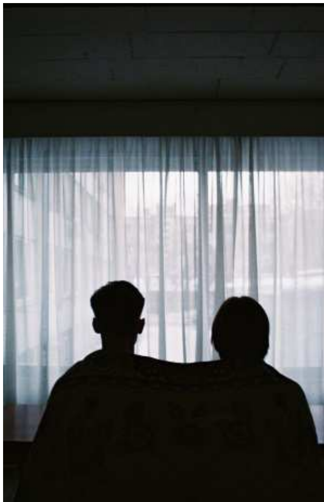
Couverture, De la série La Génération Poutine, © Daria Minina

Daria Minina, née en France en 1955 Speos, PARIS