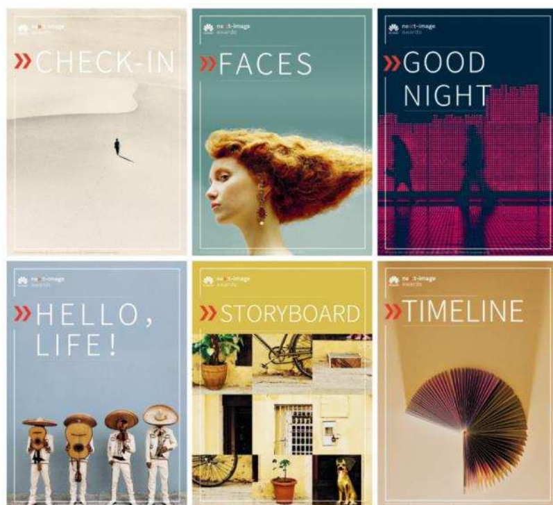
Hello, Life!; Good Night ; Check-In ; Faces ; Timeline ; Storyboard