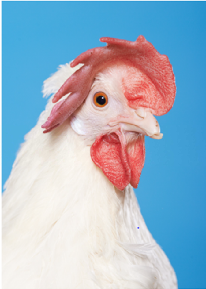
TBC